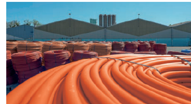
COMAP gyár Nevers-ben (FR)

A COMAP BioPERT csöveket kizárólag Franciaországban gyártják. Több mint 30 éves tapasztalattal, a nevers-i COMAP gyár évente több tízmillió méter csövet gyárt!